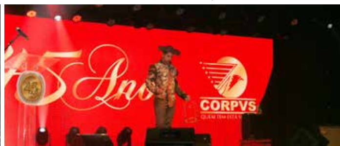
Apresentação Talentos CORPVS