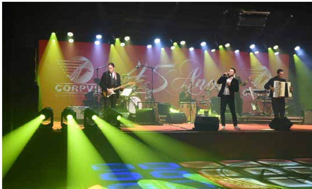
Banda Bella Vox