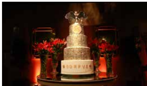
Bolo em comemoração dos 45 anos da CORPVS