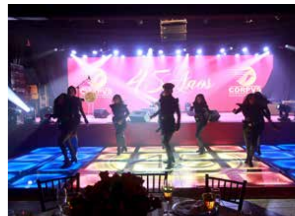
Apresentação de colaboradores