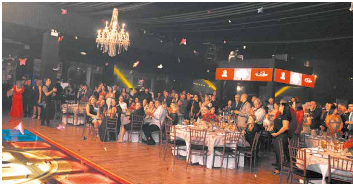
Convidados lotaram o salão