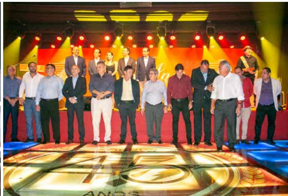
Diretoria CORPVS Ceará, Pernambuco e Rio Grande do Norte