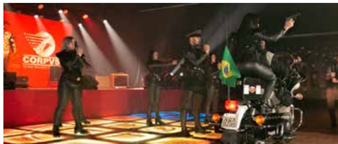
Apresentação dos colaboradores CORPVS