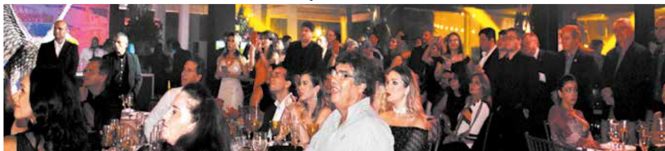
Festa CORPVS 45 anos