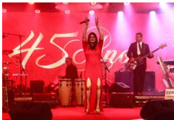
Banda Bella Vox animou os convidados

A festa de 45 anos da Corpvs Segurança aconteceu no dia 18 de janeiro, em Fortaleza (CE), e reuniu cerca de 500 pessoas entre apoiadores, parceiros e colaboradores. A “agitação” ficou por conta dos cantores Beto Barbosa e Raimundo Fagner.