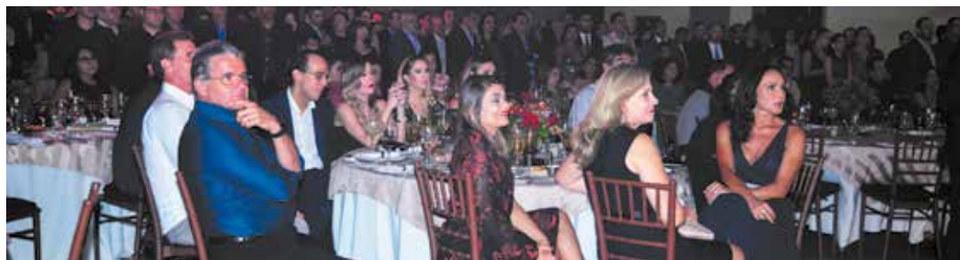
Festa CORPVS 45 anos