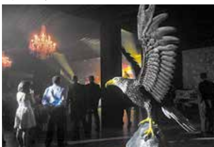
Águia confeccionada especialmente para a data